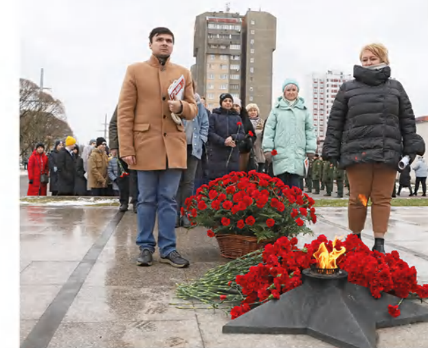
▶ Алое зарево гвоздик: никто не забудь, ничто не забудьто.