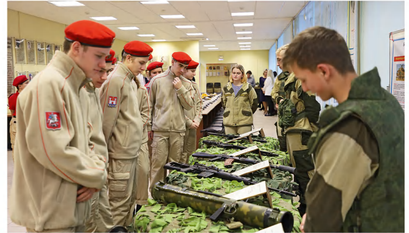
➤ Воспитанники клуба «Маргеловец» делятся своими знаниями с юнармейцами из Балтийска.

1121 километр для настоящих друзей не помеха. Такое расстояние по прямой от Балтийска до Серпухова. 15 мая прошлого года главы двух городов Серпухова и Балтийска подписали соглашение о побратимских связях между муниципалитетами. Это историческое событие состоялось на палубе МРК «Серпухов».