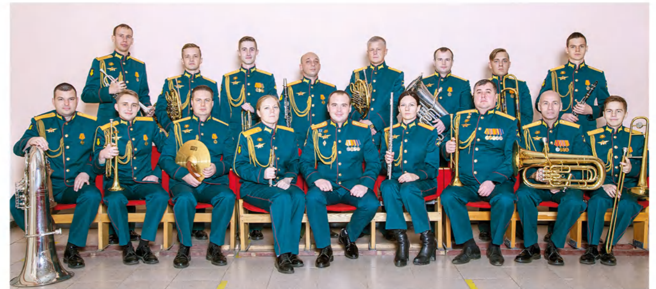
Оркестр филиала военной академии РВСН им. Петра Великого.

Афган... Многие из нас узнали о событиях чудовищной войны на территории Демократической республики Афганистан из песен в исполнении известных музыкальных групп-ансамблей «Контингент», «Голубые береты», «Каскад». Правда, вначале это были полузапрещенные песни, так как их авторы на тот момент являлись действующими военнослужащими. Такие песни, как «Опять тревога», «Зорька», «Кукушка» исполнять на официальных концертах в Кабуле или Баграме было запрещено. Другое дело — дальние воинские части, пограничные