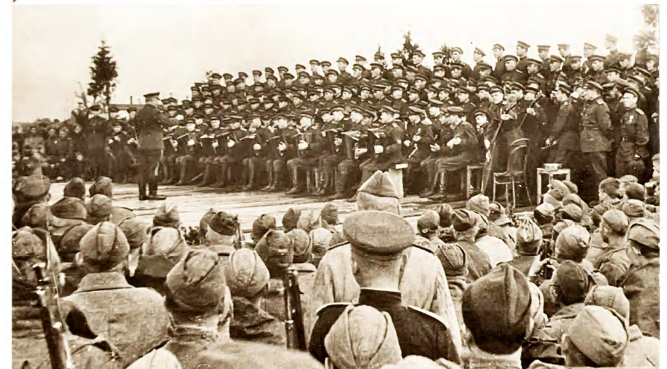
► Выступление ансамбля Александрова.

Слова из песни «Вставай, страна огромная!».