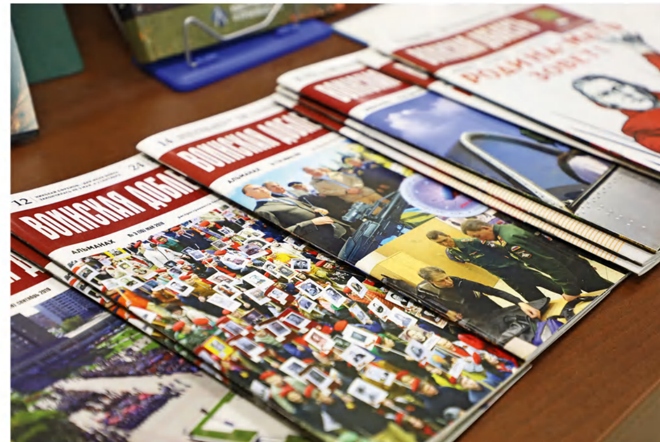
➤ Ребята из Балтийска могли ознакомиться с патриотическим изданием, которое выходит в Серпухове.

— Вообще, в Балтийске тепло, снег выпадает редко, — рассказывает серпухович. — Помню, мы еще толком не успели перейти на зимнюю одежду, как ударили морозы и снегу выпало столько, что все были поражены этим явлением, даже местные аборигены. В один из первых заснеженных дней меня и моего боевого товарища отправили на точку. Приказ простой — вырыть окоп и выживать в поле.