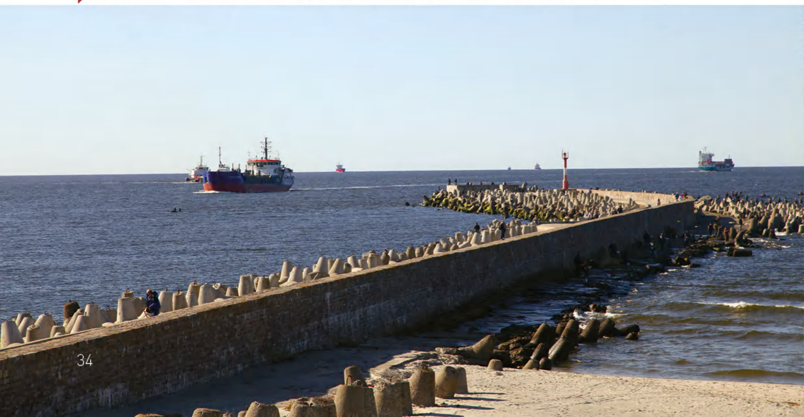
➤ Северный мол — одна из частей ворот в Калининградский залив.