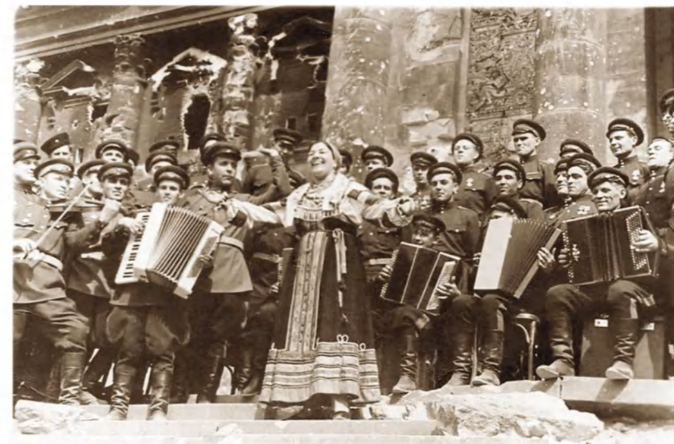
Последний военный концерт Великой Отечественной войны: Лидия Русланова пела на ступенях дымящегося Рейхстага.

Легендарная исполнительница военных песен Лидия Русланова вместе с советскими войсками дошла до Берлина. Один советский офицер, увидев ее на улице еще не освобожденного города, закричал: «Куда идешь?! Ложись: убьют!». Но Лидия Андреевна ответила: «Да где это видано, чтобы Русская Песня врагу кланялась!». А 2 мая 1945 года, спев на ступеньках поверженного Рейхстага самую любимую бойцами песню из своего репертуара «Валенки», она расписалась на одной из его колонн. После концерта у Рейхстага и Бранденбургских ворот великий советский полководец, «Маршал Победы» Георгий Жуков снял со своей груди орден и вручил его Лидии Руслановой, а позднее подписал приказ о награждении ее орденом Отечественной войны I степени.