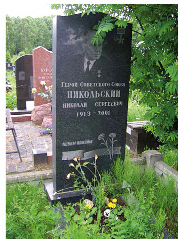
Надгробный памятник в Москве на Троекуровском кладбище (участок 4). 08.06.2010 года.