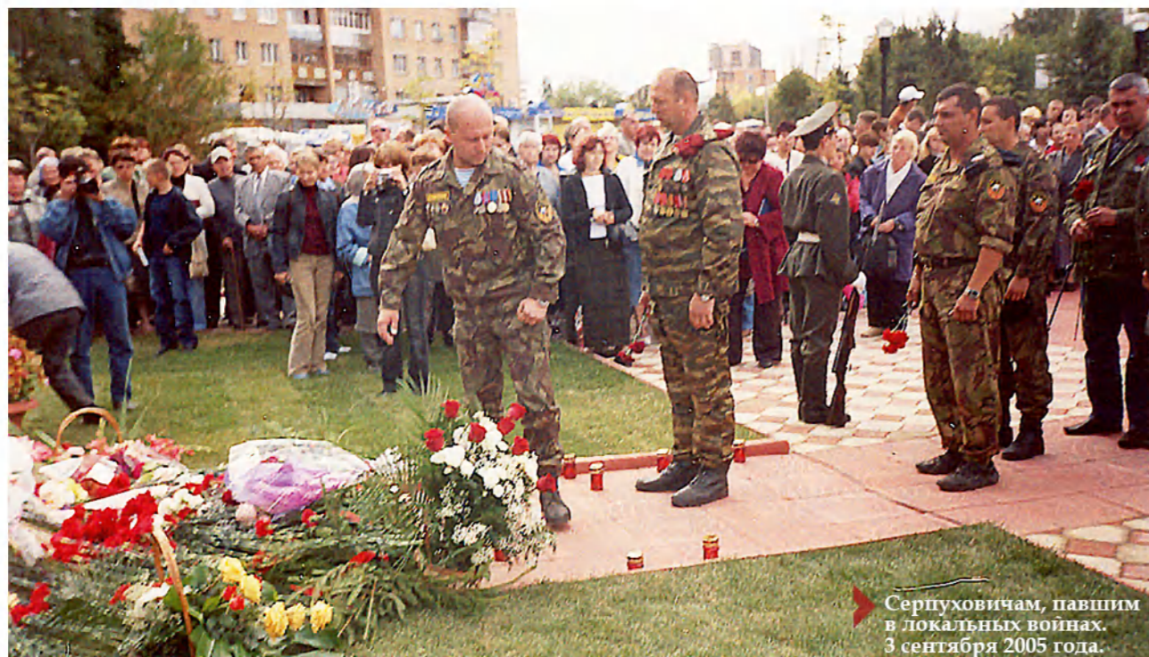
Серпуховичам, павшим в локальных войнах. 3 сентября 2005 года.

Несколько раз в год по одним и тем же датам они встречаются возле Черного тюльпана, что на Звездной площади. Бежит время. Дети, участвующие в памятных митингах, вырастают, на смену им приходит новое поколение школьников; меняется состав администрации, новые лица депутатов, журналистов. Остается неизменным одно — слезы матерей и вдов. Собравшись в этом священном для них месте, они разделяют друг с другом боль от невосполнимых потерь.