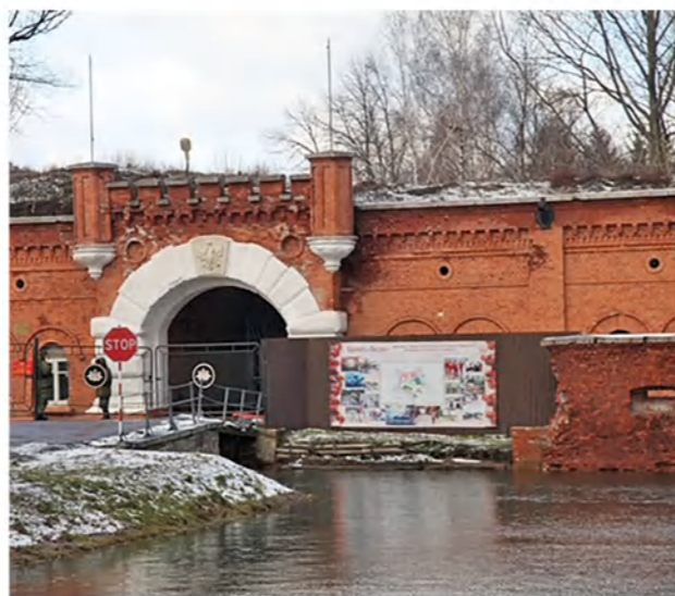
➤ Шведская крепость (крепость Пиллау) в Балтийске.